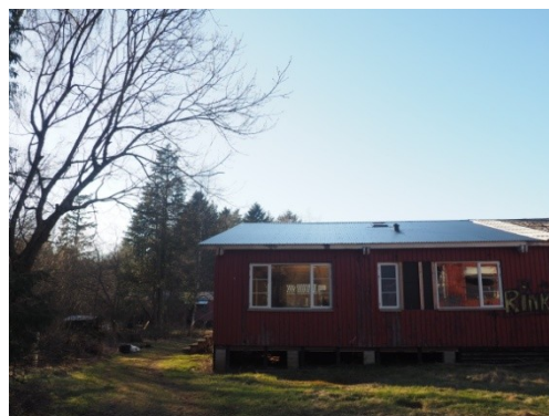
Boligen set fra øst (vinduer i køkken-alrum og badeværelse og soveværelse).