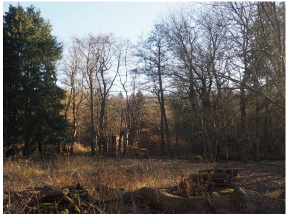
Naturen syd for boligen/terrace-dør.