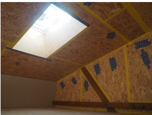
Ovenlys velux-vinduer på hems.