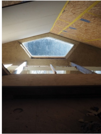
Kig til syd/skovsiden fra hems.