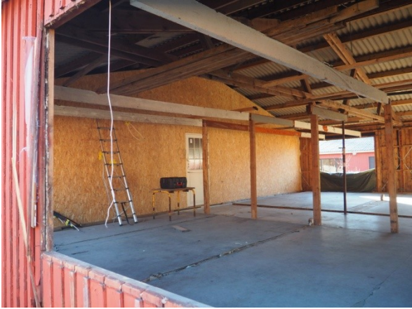
Boligens afslutning og hoveddør mod barak, hvor naboen bygger bolig og der kan opføres en fordelingsgang og evt. teknikrum.