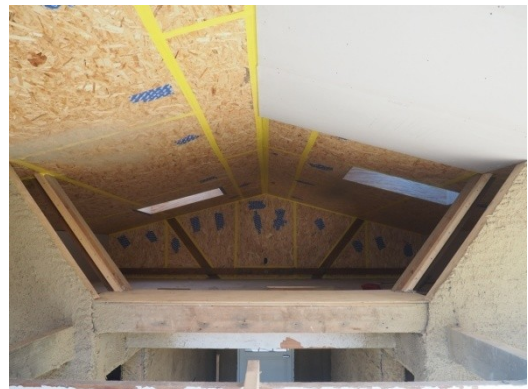
Kig ind i hemsen fra køkken-alrummet.