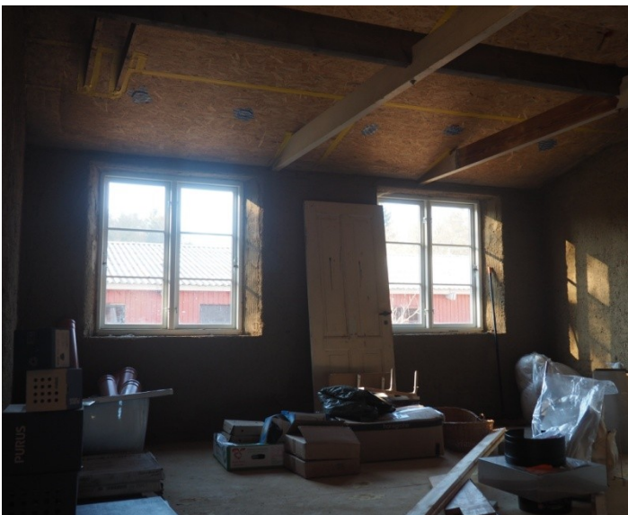
Multirum som kan deles i to.