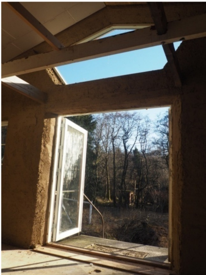
Udsigt fra alrum.