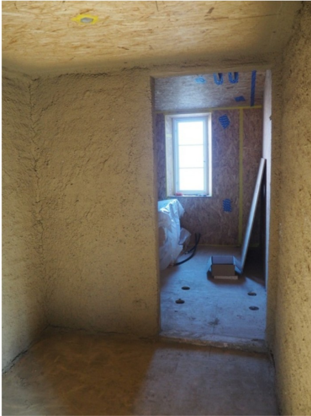
Gennemgangs/garderoberum og badeværelse i forlængelse heraf.