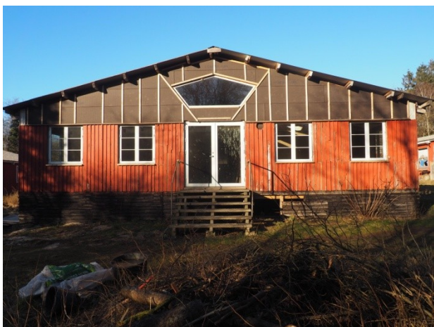
Boligen set fra syd (vinduer og terrasse dør i køkken-alrum)

Fællesudgifter bestemmes og reguleres af generalforsamlingen og aktuelt betales der 800 kr. pr. voksen månedligt, som dækker renovation, ejendomsskat, ejendomsværdiskat, vand/varme/el og vedligeholdelsesudgifter. Når boligen er færdiggjort vil vand/varme/el forbrug betales individuelt for boligen.